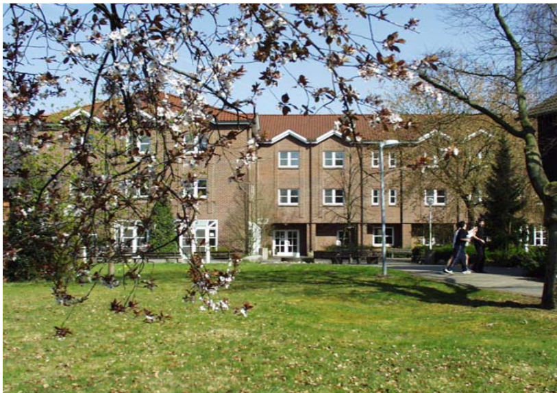
Unterkunftsgebäude „Haus Europa“

Alle Zimmer sind ausgestattet mit Dusche und WC.